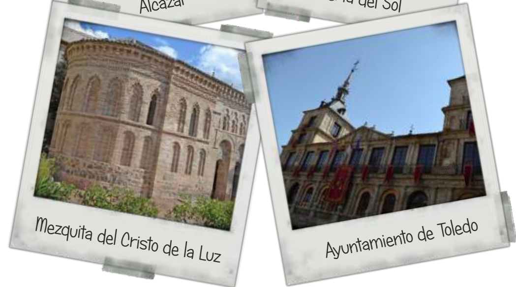
Mezquita del Cristo de la Luz