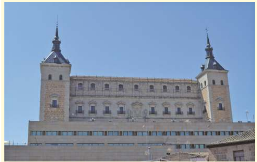
La fachada norte es la más emblemática y representativa del Alcázar.

Los restos más visibles de esta época son los de la fortaleza medieval. No son muchos pero son indicativos de la importancia del edificio y de la gran influencia que ejerció sobre la construcción posterior ya que se aprovecharon estructuras.