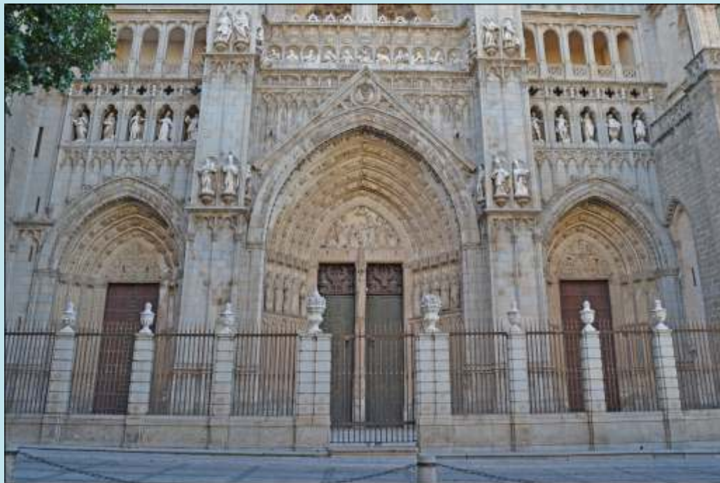
Fachada de la Catedral con las tres puertas (de izquierda a derecha: Del Infierno, del Perdón o de los Reyes y la del Juicio final). Abajo, detalle de la puerta del Perdón o de los Reyes