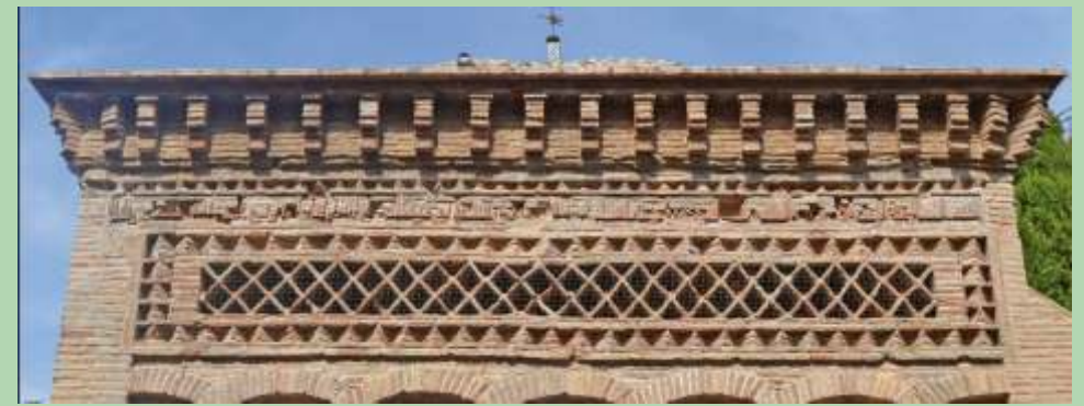
¡Fíjate en la inscripción de la fachada oeste en la que pone quién y cuándo se

Todas las mezquitas están orientadas hacia el este, sur-este en el caso de las mezquitas de España, el lugar donde se encuentra la Meca, pero aquí tenemos una excepción: Las mezquitas construidas después del Califato de Córdoba, el estado musulmán en el que gobernó el califa Abderramán III en el año 929 y que duró hasta el año 1031. Como fue un califato muy importante (cuando gobierna un califa se llama califato y cuando gobierna un rey es un reinado) las mezquitas que se construyeron después del comienzo de su gobierno se construyeron orientadas hacia la ciudad de Córdoba, hacia el sur