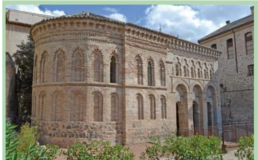
En esta fotografía vemos la mezquita original y el ábside añadido al convertir el templo en iglesia.

- UN ARCO DE MEDIO PUNTO, arco en forma de media circunferencia. Este tipo de arco se construía a partir de pequeños elementos juntos entre sí, llamados dovelas, que podían ser de distintos materiales