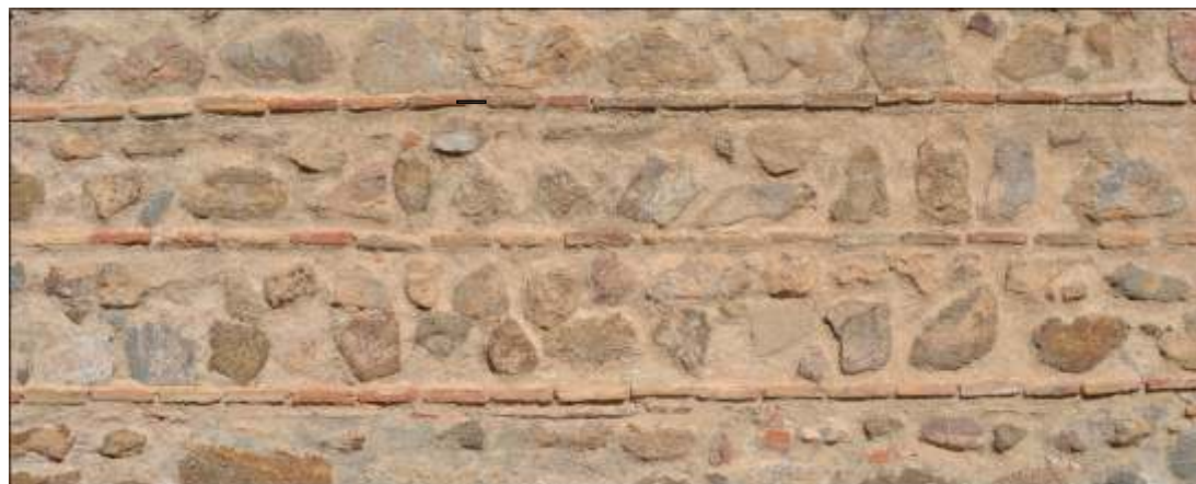
Ejemplo de aparejo toledano en la muralla de la ciudad.

En el caso de Toledo existe una manera de construir muros denominada "aparejo toledano", que consistía en construir mezclando ladrillos y piedra en "cajones" verticales entre filas de ladrillos (verdugadas). Este tipo de construcción es de época medieval y se puede ver en muchas construcciones toledanas de la época. Por supuesto, lo vemos en la muralla y los puentes de la ciudad.