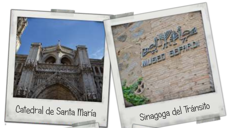
Catedral de Santa María